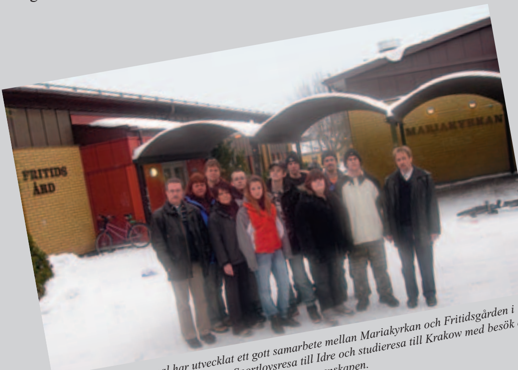
Ungdomar och personal har utvecklat ett gott samarbete mellan Mariakyrkan och Fritidsgården i Margretelund som ligger dörr i dörr. Sportlovsresa till Idre och studieresa till Krakow med besök och stöd till barnhem är ett par exempel utöver vardagsgemenskapen.

Man brukar tala om kyrkan mitt i byn och så upp och servicehuset för de äldre är alldeles inpå oss och mer på vardagarna. Vissa tittar in utan att det är samtal. På söndagkvällarna samlas både vuxna och barn. Det är just det vi vill att Mariakyrkan ska bli tydlig.