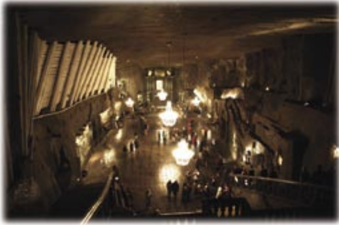
Kyrkan på 130 meters djup

nu avslutade Krakowprojektet varit med och byggt, består av 8 enrumslägenheter med badrum och gemensamt kök och tvättstuga. Här får ungdomarna träna sig på ett liv utanför barnhemmet, för har man levt hela sitt liv på barnhem och plötsligt ställs på gatan, är det stor risk att man råkar illa ut och snart står där med ett barn som i sin tur hamnar på barnhem. Vi umgicks med barnen och ungdomarna och såg hur de bodde.