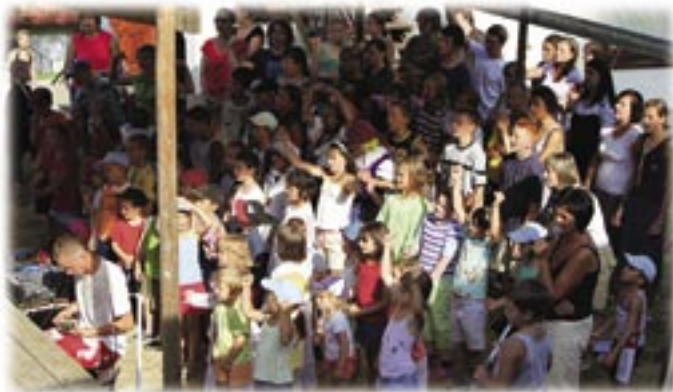
Barnen i Zmiaca

På programmet stod också ett besök på ett par olika barnhem. Ett utanför Krakow, Zmiaca, som vi gett visst stöd. Det lyder under Krakows stad men har också sponsrats av en äldre tysk man,