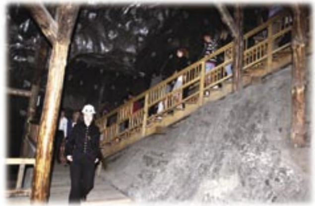
Guidad tur i gruvan

Det här var de stora punkterna under resan, dessutom hann vi ju med sightseeing i Krakow, som är