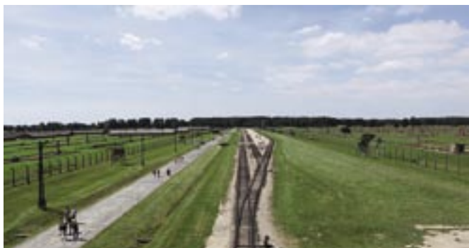
Järnvägsspåren innanför "Dödsporten" i Birkenau

smågatstenar, var och en symboliserande en människa som berövats sitt liv i dessa läger. Att vandra genom badhuset, där de av de nyanlända som ej fördes direkt till gaskamrarna berövades all mänsklig värdighet tillsammans med sin identitet, sitt hår (man kan fortfarande läsa texten "HAARSCHNEIDERAUM" på väggen) och sina sista ägodelar. Istället för namn blev de tatuerade med fängnummer. Att gå in i Auschwitz under portalen med den cyniska texten "ARBEIT MACHT FREI". Att se montrarna med barnkläder och den enorma montern