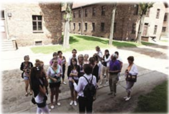
Guidning i Auschwitz

En av huvudpunkterna på resan var besöket i Auschwitz-Birkenau. Att stå vid monumentet i Birkenau bestående av en miljon trehundra tusen