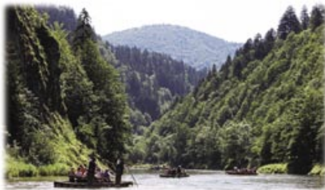
Flottfärd i Tatrabergen

Intrycken från Auschwitz tar tid att smälta och därför passade nästa dags utflykt till nationalparken i Tatrabergen bra. På stora flottor gled vi i sakta mak nedför floden Dunajec med Polen på ena sidan och