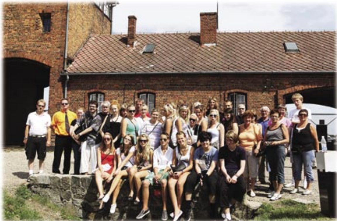
Hela gruppen samlad vid huvuporten till Birkenau.

Text: Birgitta Andersson